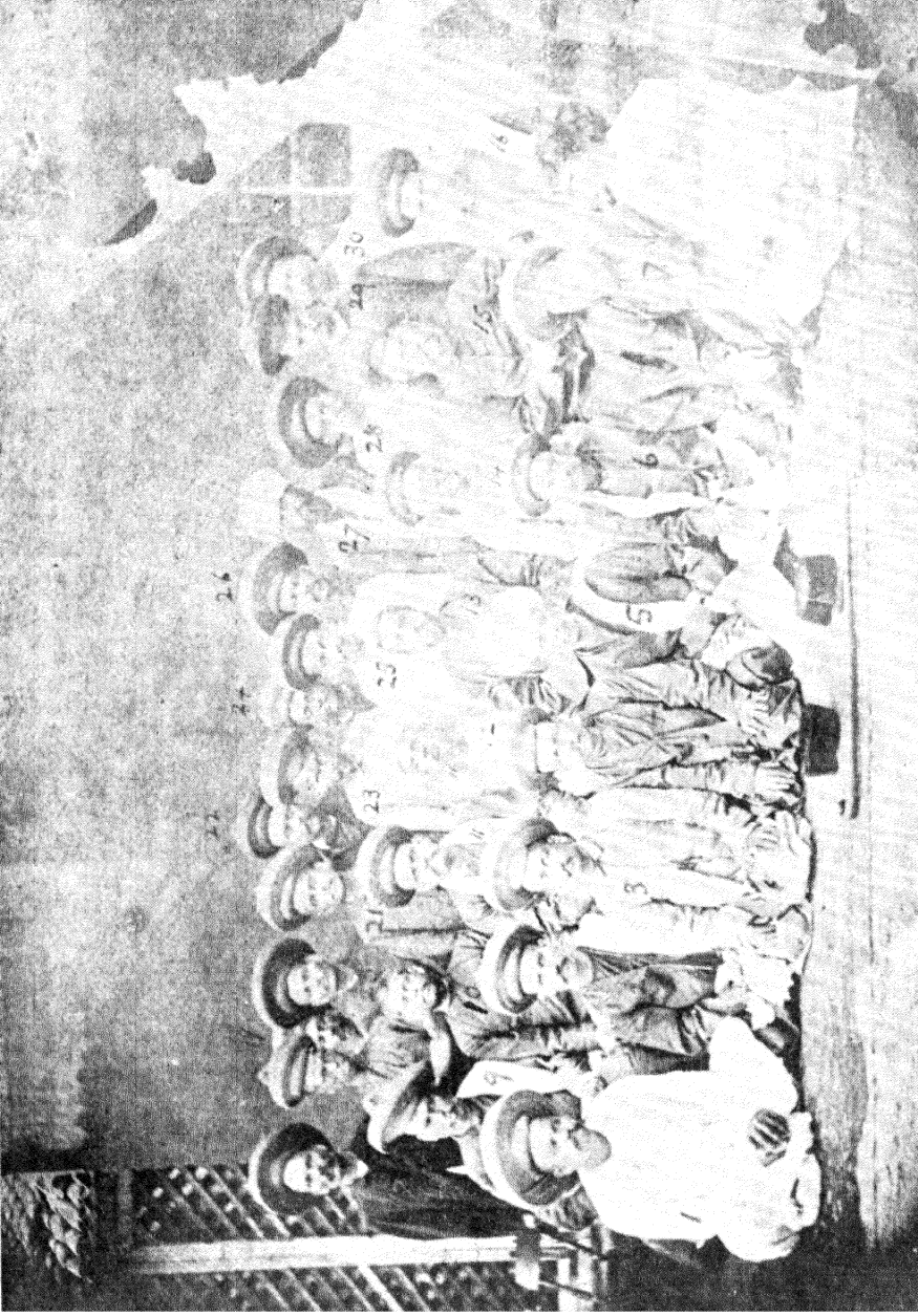
प्रार्थनासमाजाचे जुने सभासद